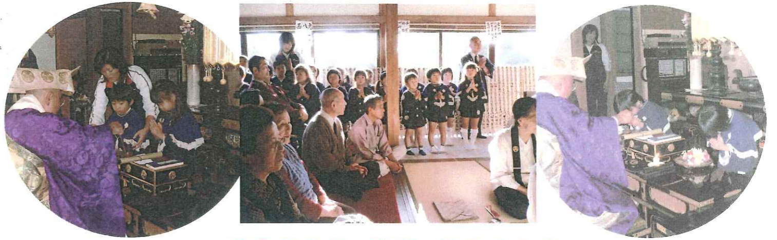
園児の献灯・献花・宗歌の合唱