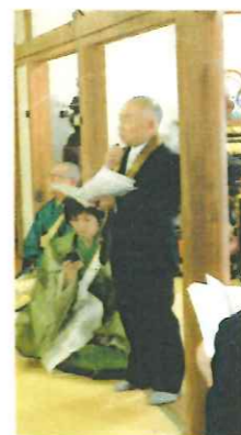
金杉総代 経過報告