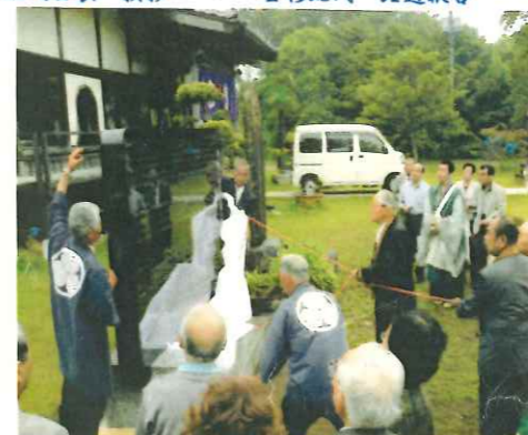
落慶記念石彫刻除幕式