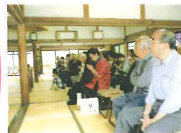
ご出席檀様 極楽寺住職挨拶拝聴